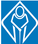
สัญลักษณ์ผู้สูงอายุ