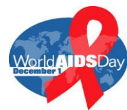
สัญลักษณ์วันเอดส์โลก