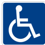
สัญลักษณ์คนพิการ