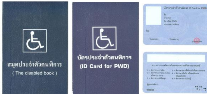
ตัวอย่างบัตรและสมุดประจำตัวคนพิการ

(๔) ไม่เป็น บุคคลซึ่งอยู่ในความอุปการะของสถานสงเคราะห์ของรัฐ